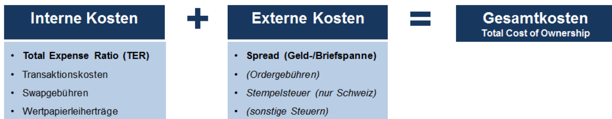
Abbildung 2: Kostenkomponenten von ETFs

Zunächst erkennt man, dass auch bei ETFs zwischen internen und externen Kosten unterschieden werden kann. Wie sich die internen Kosten im einzelnen darstellen, hängt zunächst von der Replikationsmethode des ETF ab. Im Falle der „vollen“ oder „physischen“ Replikation 1 fallen Transaktionskosten beim regelmäßigen Rebalancing der Indexzusammensetzung an. Die Transaktionskosten eines Investmentfonds sind grundsätzlich nicht in der TER enthalten und kommen somit auch bei einem ETF als weitere Kostenkomponente hinzu. Andererseits kann ein physisch replizierender ETF Erträge durch Wertpapierleihe 2 generieren, die sich kostenreduzierend auswirken. Im Falle der „swap-basierten“ oder „synthetischen“ Replikation 3 fallen keine Transaktionskosten an, dafür allerdings